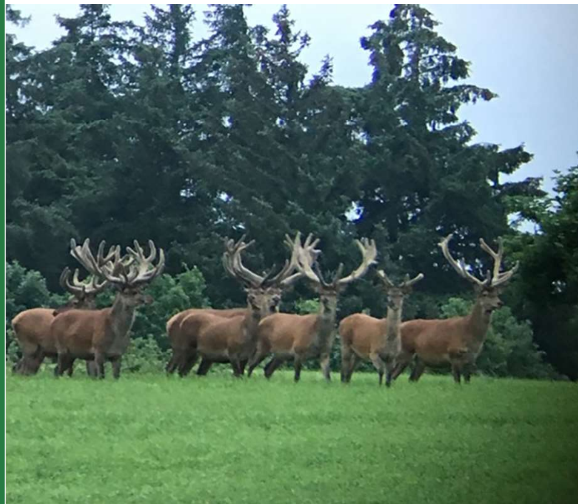
Hjortetræf ved Sepstrup.